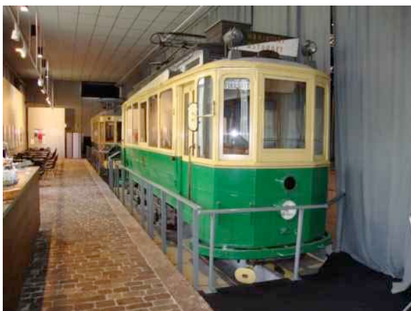
Quinto veicolo: in servizio dal 1920 al 1959.