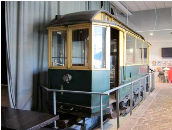
Quarto veicolo: in servizio dal 1911 al 1931.

Terzo veicolo: in servizio dal 1900 al 1923.