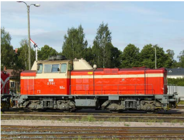
Foto 25 - Locomotiva diesel idraulica Dv12 2701 in deposito a Riihimäki - agosto 2012

Per quanto riguarda invece le macchine diesel che chiameremmo "da manovra", cioè con cabina centrale/paracentrale e avancorpi, resistono numerose le Dv12 (foto 25) costruite tra il 1963 ed il 1979 in 192 esemplari, suddivise in tre diverse serie (2500, 2600 e 2700) che, pur con varianti meccaniche, hanno tutte la stessa carrozzeria. Sono macchine diesel-idrauliche lunghe 14m, rodiggio B'B' da 1000kW, da 60.8 a 65.2t di peso a seconda della versione, capaci di 125 km/h. Le Dv12 sono tutt'ora diffusissime in ogni impianto del paese, e non è raro vederle in azione in piena linea.