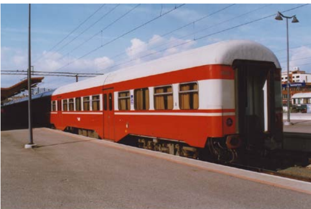
Foto 29 - Vettura Eil 25042 a vestiboli paracentrali per servizi suburbani a Tampere - agosto 2004

A metà anni 80 fu evidente la necessità di vetture più moderne, così tra il 1988 ed il 1992 si costruirono 80 vetture intercity, foto 30, atte ai 160 km/h e prime a vestire la nuova livrea bianco/rossa, poi nel 1998 arrivarono le prime vetture intercity a due piani, foto 31, cuccette comprese, fino alle recentissime bar-ristorante e semipilota, sempre a due piani, entrate in servizio dal 2013.