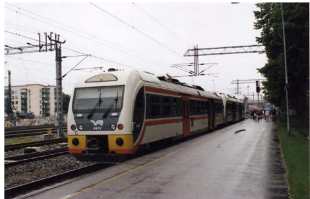
Foto 24 - Doppia di automotrici Dm12 nei colori originali a Karjaa, appena arrivata da Hanko - giugno 2010

Causa il fallimento del programma Dm11, nel 2001 fu bandita una nuova gara per 16 automotrici (con un'opzione, finora non esercitata, per altre 20), che fu vinta dalla ceca CKD Vagonka: nasceva così il gruppo Dm12, foto 24. La prima Dm12 giunse in Finlandia nel dicembre 2004, e messa subito "sotto torchio". I risultati delle prove invernali furono positivi stavolta, e quindi il problema automotrici era finalmente risolto dieci anni dopo l'esperienza con la Dm10.