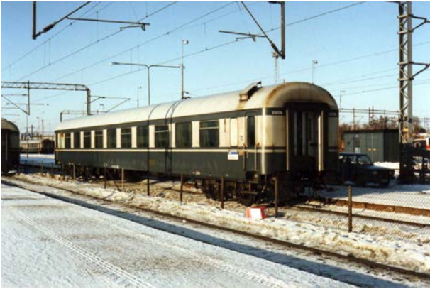
Foto 28 - Carrozza di 2a classe Eit 23076, costruzione 1968, a Seinäjoki nel febbraio 1994