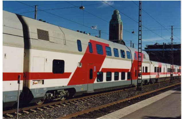
Foto 31 - Vettura Intercity bipiano Eds 28201 in livrea originale ad Helsinki - agosto 1999

A differenza del materiale di trazione, molto spesso acquistato all' estero, tutte le carrozze finlandesi sono state costruite in Finlandia ad eccezione dei primi prototipi delle "blu", costruiti in Germania, sia direttamente dalle ferrovie nelle officine di Helsinki Pasila (Pasilan Konepaja) che da privati (Valmet poi Trans-tech-Talgo ed oggi nuovamente Transtech).