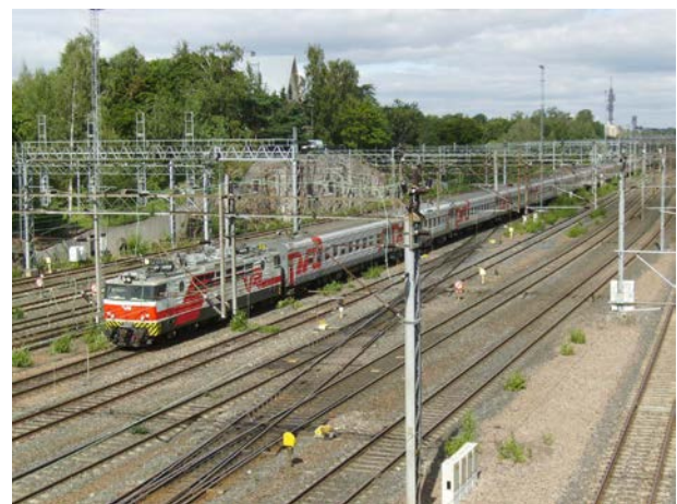
Foto 22 - Treno P32 "Tolstoi" Mosca-Helsinki in arrivo nella capitale finlandese - agosto 2012

Grazie ai nuovi treni, alla velocizzazione delle linee ed ai controlli di frontiera effettuati sul treno in movimento (prima il treno stava fermo fino a controlli completati), il percorso Helsinki-San Pietroburgo, ora ridotto a 417 km grazie alla nuova linea veloce tra Kerava e Lahti, è effettuato in poco più di tre ore e mezza. Tra le due città ci sono ora tre coppie di treni giornalieri effettuati con gli Sm6, cui si affianca ancora il "Tolstoi" a materiale ordinario RzD per Mosca, foto 22.