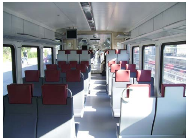
Foto 19 - Sui Flirt finlandesi, la sagoma larga permette la disposizione 3+2 dei sedili - Hyvinkää, agosto 2012

il collegamento passeggeri tra Helsinki e San Pietroburgo, che all'epoca richiedeva poco meno di 6 ore per soli 443 km. L'esito dei test non fu particolarmente esaltante (il Pendolino era trainato, visto che la linea russa è elettrificata a 3kV Cc come in Italia, e l'armamento era a dir poco precario), e la massima velocità raggiunta fu 80 km/h, il che non consentì mai l'intervento dell'impianto di assetto cassa in curva, la cosa che invece interessava maggiormente ai russi.