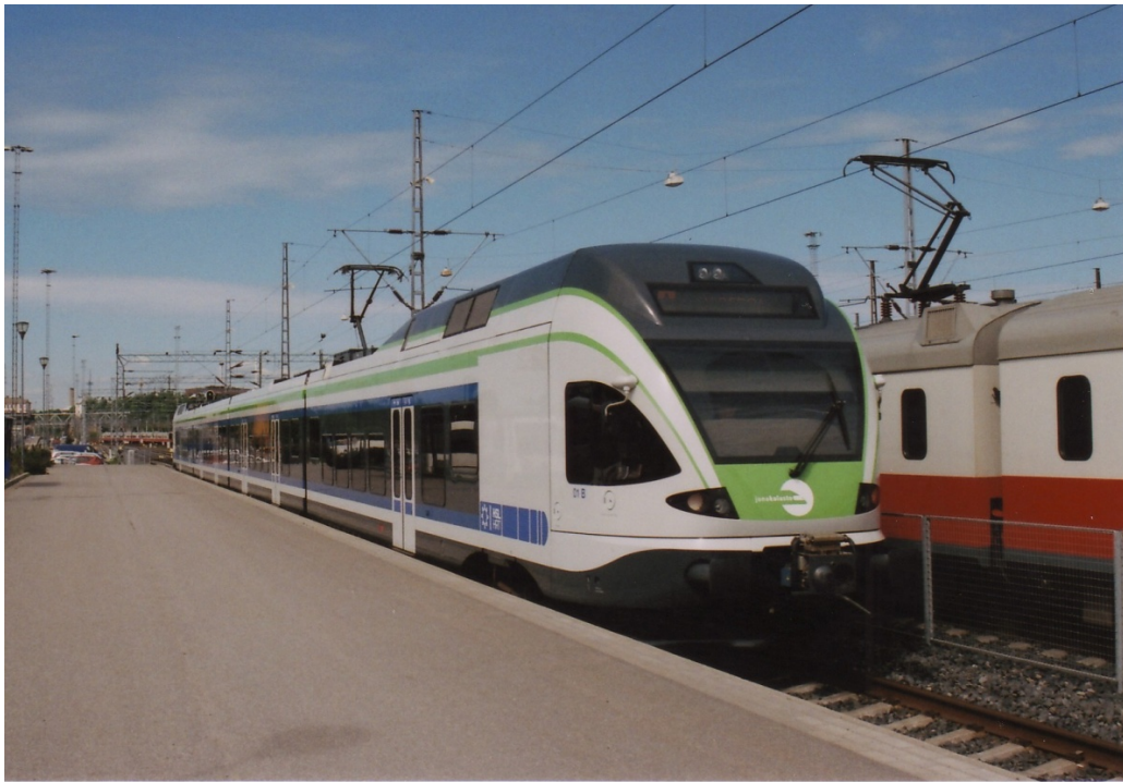
Foto 18 - Il primo elettrotreno Sm5 della serie, lo 01, in partenza dalla stazione di Helsinki - giugno 2010

Nel 2003 si costituì una nuova società ferroviaria chiamata "Junakalusto" tra VR e le municipalità dell'area metropolitana della capitale (oltre ad Helsinki anche Espoo, Kauniainen e Vantaa), società oggi confluita in HSL, in cui le ferrovie statali detengono il 35%, ed il cui compito istituzionale è l'esercizio del frequente servizio suburbano. Il nuovo operatore bandì una gara per 41 nuovi treni che sarebbero diventati il nuovo gruppo Sm5, foto 18 e 19.