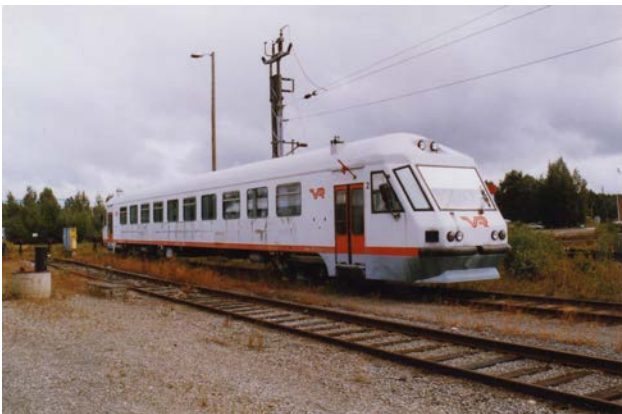
Foto 23 - Automotrice diesel prototipo Dm10 4301 ormai accantonata al deposito di Joensuu nel 2004

Per ovviare a questa mancanza di automotrici diesel, VR decise di costruirsi in casa presso le officine di Pieksamäki un prototipo chiamato Dm10, foto 23, prendendo una normale carrozza, costruendo due cabine di guida e motorizzando il tutto con due motori Volvo da 157kW recuperati da altrettanti autobus appena dismessi dal comune di Helsinki. Questo strano mezzo, rodiggio (A 1)' (1 A)', velocità massima 100 km/h, 80 posti a sedere e lungo ben 31.15m per 53t di peso, iniziò le prove nel 1994. Nel 1995 venne immesso in servizio prima sulla Ylivieska-Iisalms ad ovest, poi sulla più breve Savonlinna-Parikkala nell'est.