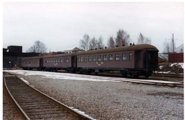
Foto 27 - Carrozze con cassa in legno sul piazzale delle ex officine di Helsinki Pasila - marzo 1995

Le vetture con cassa in legno, foto 27, sparirono definitivamente dal servizio passeggeri a metà anni settanta, e iniziò così il lungo regno delle "sininen" (blu in finlandese), foto 28, le oltre 600 carrozze costruite tra il 1961 ed il 1986, sicuramente confortevoli rispetto al recente passato, ma figlie di un progetto originale di inizio anni 60, ben evidenziato dalla velocità massima di 140 km/h. Una variante delle carrozze blu è rappresentata dalle 50 rosse Eil più le 7 Eilf, del 1982-1987, foto 29, con due vestiboli paracentrali e porte automatiche, utilizzate per i treni pendolari più pesanti da Helsinki a Tampere.