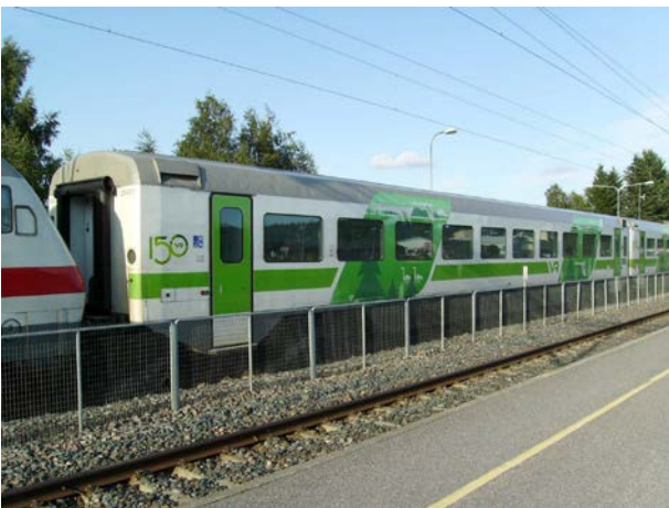
Foto 30 - Carrozza Intercity con nuovi colori e logo del 150° delle ferrovie a Kirkkonummi - agosto 2012

A metà anni 80 fu evidente la necessità di vetture più moderne, così tra il 1988 ed il 1992 si costruirono 80 vetture intercity, foto 30, atte ai 160 km/h e prime a vestire la nuova livrea bianco/rossa, poi nel 1998 arrivarono le prime vetture intercity a due piani, foto 31, cuccette comprese, fino alle recentissime bar-ristorante e semipilota, sempre a due piani, entrate in servizio dal 2013.