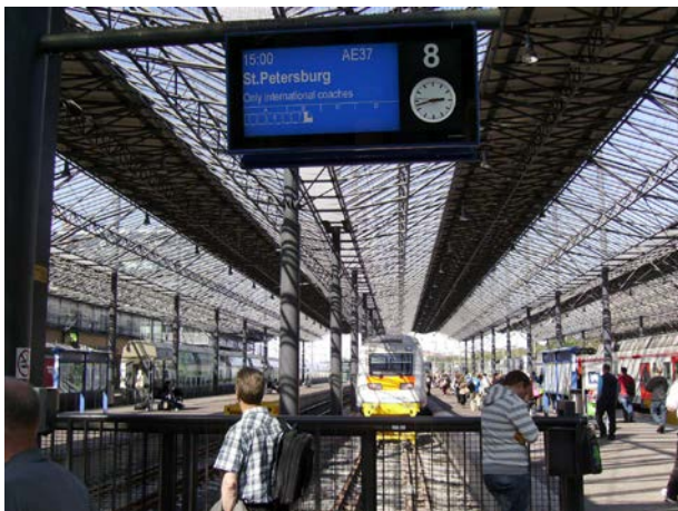
Foto 20 - Pendolino Sm6 pronto al binario 8 di Helsinki come treno AE37 per S. Pietroburgo - agosto 2012

Qualche anno più tardi, visto che c'era ancora l'interesse politico in entrambi i paesi, la prova fu ripetuta, e visti i grossi passi avanti fatti sulla parte russa della linea (poco più di un terzo del totale) si decise definitivamente che era ora di migliorare il collegamento, visto che nel frattempo San Pietroburgo era (ri)diventata un meta turistica molto richiesta. Nell'ottobre 2006 venne quindi costituita tra VR e RzD la società "Karelian trains", che ordinò ad Alstom nel settembre 2007, 4 treni Pendolino bicorrente (25kV ca e 3kV cc, 220 km/h, nuovo gruppo Sm6), foto 20 e 21, a 7 casse per i servizi tra Helsinki e S. Pietroburgo, destinati a sostituire ed aumentare le tre coppie giornaliere di treni di materiale ordinario ("Sibelius" con vetture VR e "Repin" con vetture RzD tra le due città, oltre al "Tolstoi" sempre RzD che prosegue fino a Mosca).