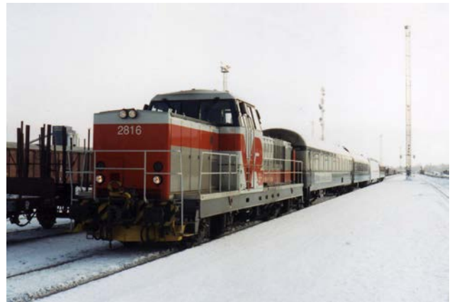
Foto 26 - Locomotiva diesel elettrica Dr16 2816 nei colori originali a Rovaniemi - febbraio 1994

L'altra serie esistente di macchine "da manovra", in realtà utilizzate prevalentemente per servizi in linea, è la Dr16, serie 2800 VR, foto 26, costruita da Valmet-Transtech tra il 1985 e il 1992 in 23 esemplari contro i 40 inizialmente previsti. Le imponenti Dr16 (17.6 m di lunghezza per 83t di peso) a cabina centrale, sono macchine diesel-elettriche rodiggio Bo'Bo' da 1680kW e 140 km/h, dotate per la prima volta in Finlandia di motori asincroni trifasi di costruzione Strömberg. Per chi volesse vedere le Dr16 dal vivo, è bene che si prepari a lunghe trasferte al nord o all'est, da sempre regno di queste macchine.