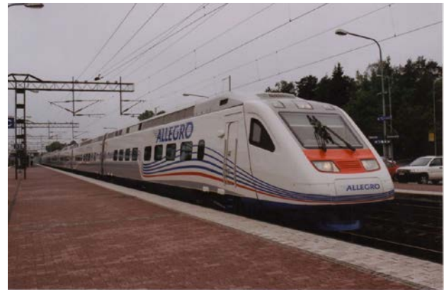
Foto 21 - Pendolino Sm6 Allegro in corsa prova in transito a Tikkurila nel giugno 2010

Gli Sm6, con il nome commerciale Allegro (riferito al tempo ritmato veloce in musica), costruiti in Italia a Savigliano, entrano in servizio a Dicembre 2010 con il cambio orario ed espletano inizialmente due coppie di treni, mentre dall'anno successivo con tutti i 4 treni in servizio, sostituiscono le composizioni ordinarie, viaggiando a volte anche in doppia.