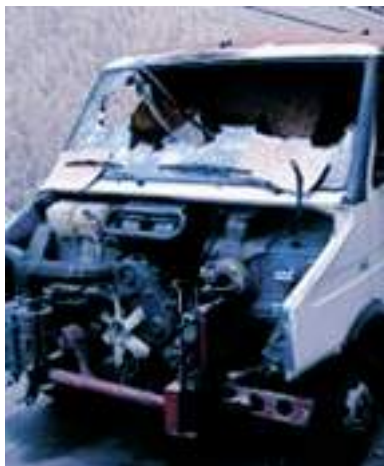
Un furgone devastato dal fuoco