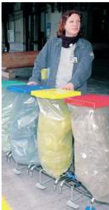
Pulizie in stazione