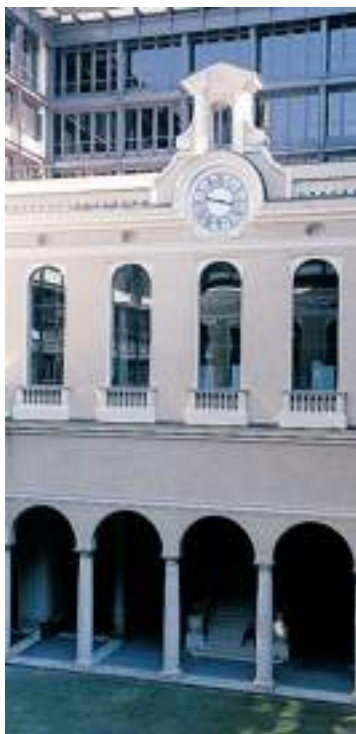
Palazzo di giustizia